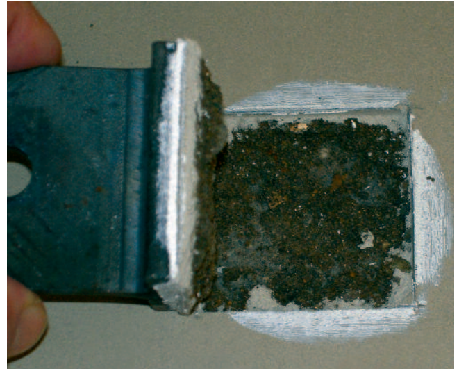
Haftzugfestigkeitsprüfstempel auf verfestigten und gespachtelten Zementestrichen.

Als wasserbasierte und extrem dünnflüssige Emulsion kann die Tiefgrundierung UZIN PE 425 den mineralischen Untergrund optimal benetzen und tief in ihn eindringen. Sie führt somit zur tiefgreifenden Verfestigung der gesamten oberen Estrichrandzone. UZIN PE 425 ist damit üblichen filmbildenden Epoxidharzgrundierungen in der Verfestigungswirkung weit überlegen. Mürbe Estriche, die eigentlich rückgebaut werden müssten, können sich so für den Neuaufbau von Fußbodenkonstruktionen „retten“ lassen.